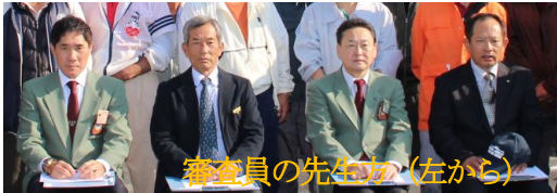
審査員の先生方(左から)