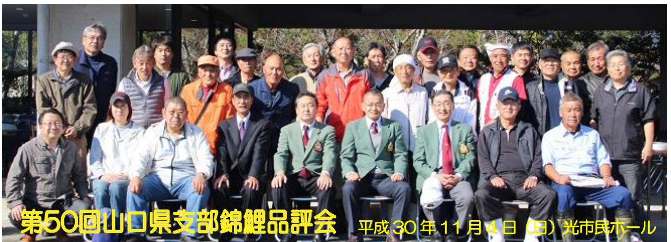
第50回山口県支部錦鯉品評会 平成30年11月4日(日) 光市民ホール

2019年を記憶に残る年とするため、会員の皆様の気持ちをひとつにして英知と行動で乗り切って行きたいと思っております。今年もご家族の幸せ多い日々でありますよう心よりお祈り申し上げます。